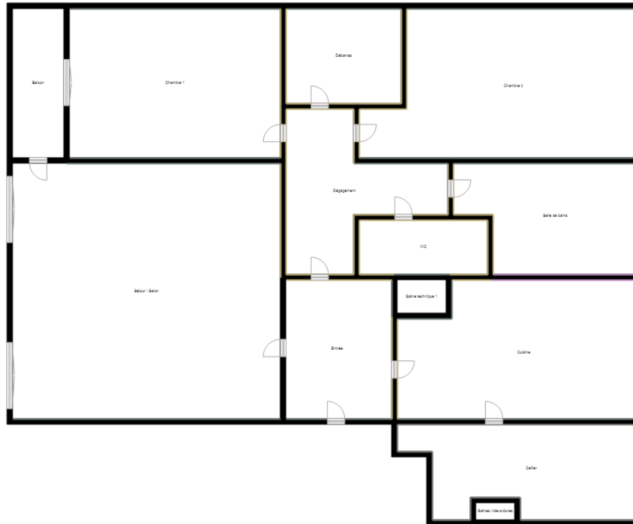
PLANCHE DE REPERAGE

Bien : 53LAG0101 - 8, Square R. Kennedy - Logement 1 - ESC AG - R+1 77400 ST THIBAULT DES VIGNES